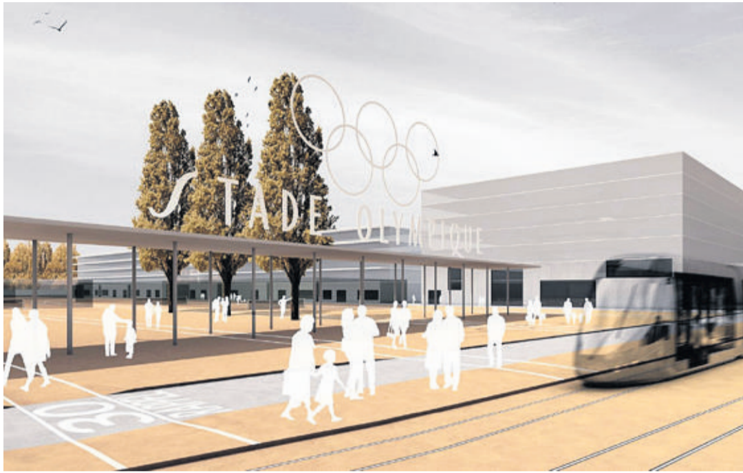
En 2010, le projet lauréat du concours d'urbanisme des Plaines-du-Loup prévoyait de conserver le portique de la Pontaise. Des élus de tous partis n'en veulent plus. TRIBU ARCHITECTURE

Dans le cadre du programme Métamorphose, l'urbanisation du quartier des Plaines-du-Loup avait donné lieu à un concours, remporté en 2010 par les architectes lausannois du bureau Tribu. Leur projet proposait de conserver, au cœur de cet écoquartier, une douzaine de terrains de tennis sur ce qui devait être une «esplanade des sports». Celle-ci prendrait la place qu'occupe actuellement le stade de la Pontaise. Dans ce cadre, les architectes de Tribu avaient imaginé de conserver symboliquement le portique olympique en guise d'entrée sur cette vaste esplanade.